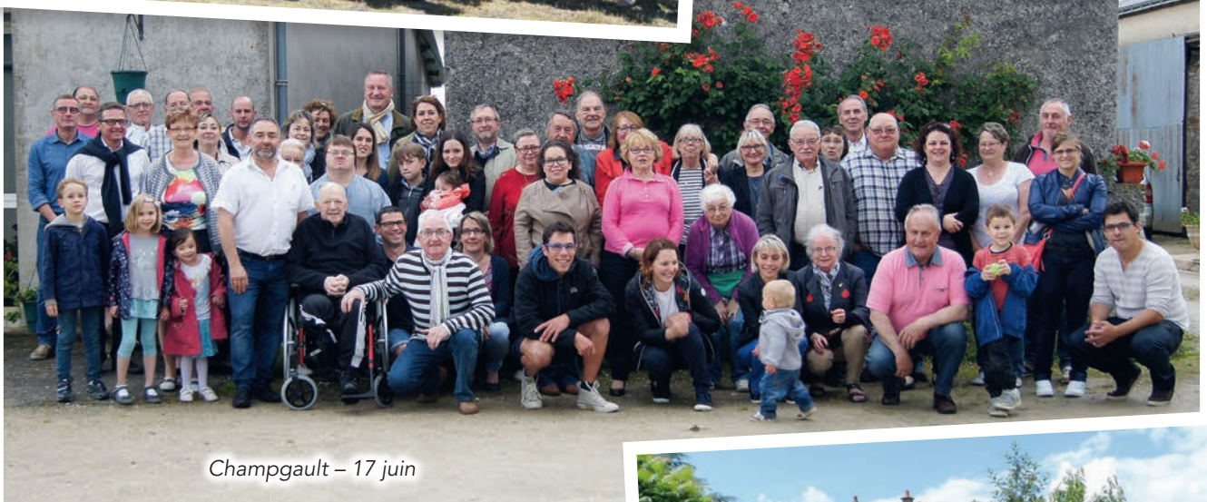
Champgault – 17 juin