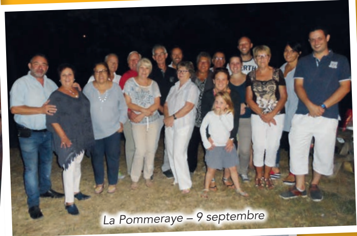
La Pommeraye – 9 septembre