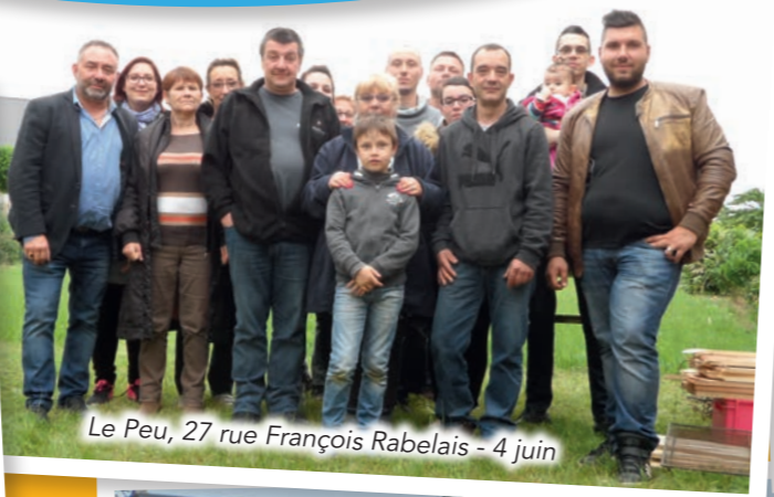
Le Peu, 27 rue François Rabelais - 4 juin