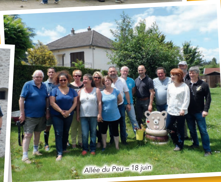
Allée du Peu – 18 juin