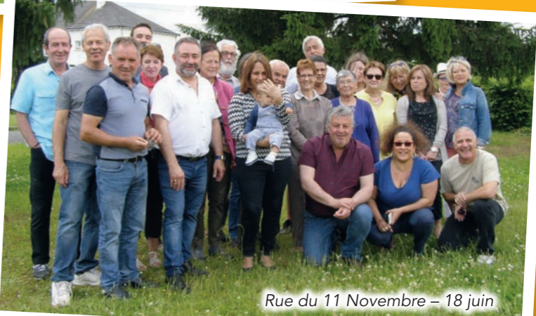
Rue du 11 Novembre - 18 juin