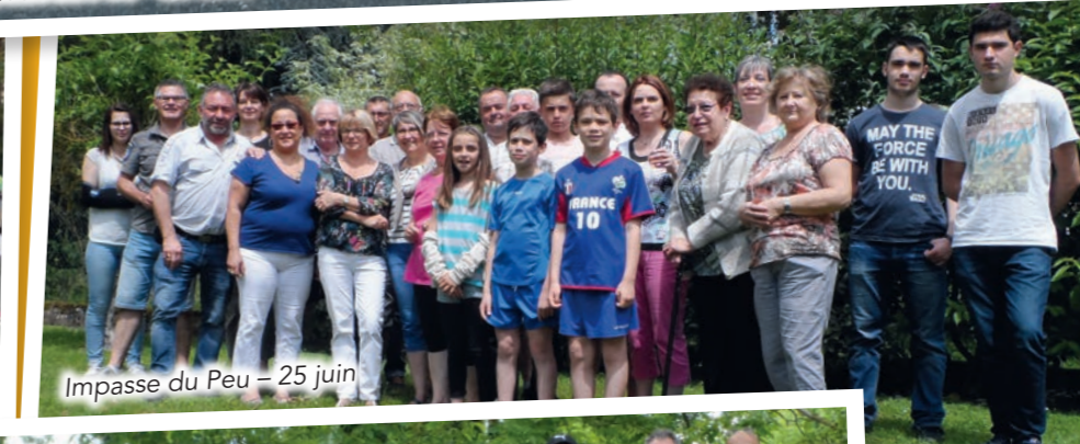
Impasse du Peu - 25 juin