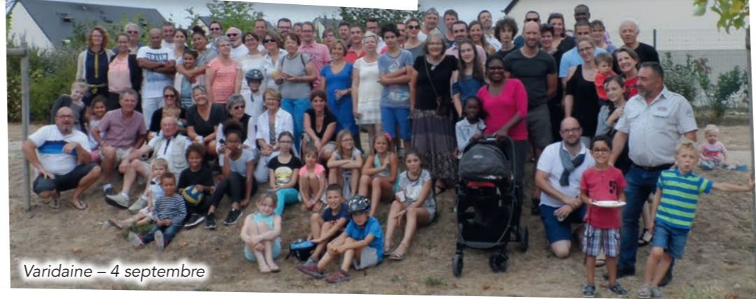
Varidaine - 4 septembre