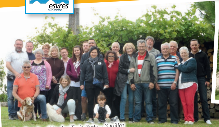
Les Reçais, allée des Trois Puits – 3 juillet