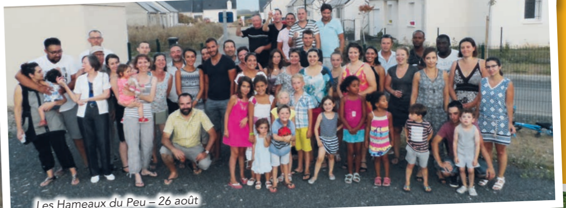
Les Hameaux du Peu - 26 août