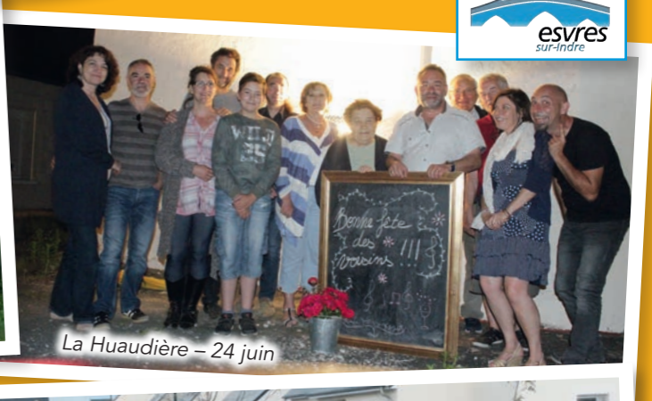
La Huaudière - 24 juin