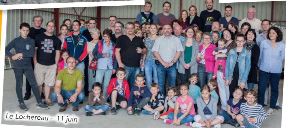
Le Lochereau - 11 juin