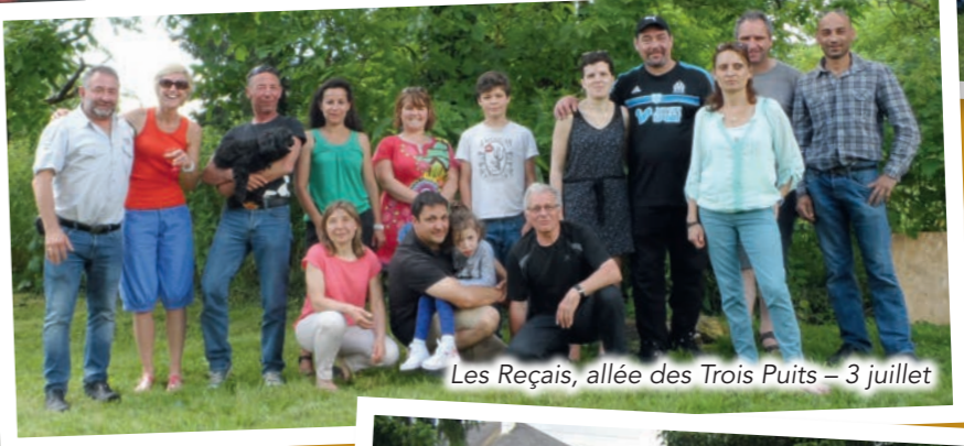
Les Reçais, allée des Trois Puits - 3 juillet