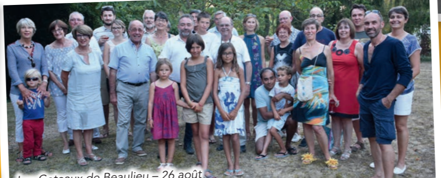
Les Coteaux de Beaulieu - 26 août