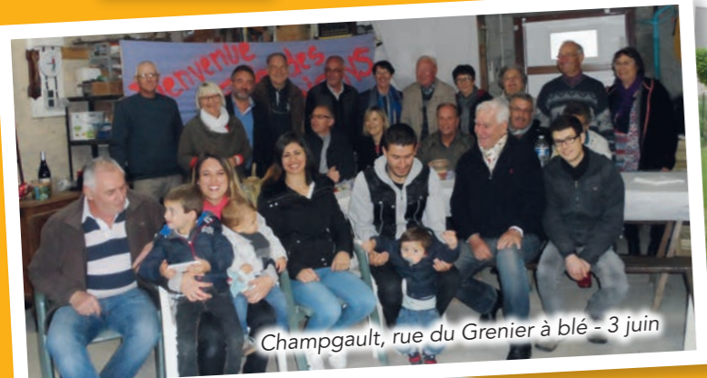
Champgault, rue du Grenier à blé - 3 juin