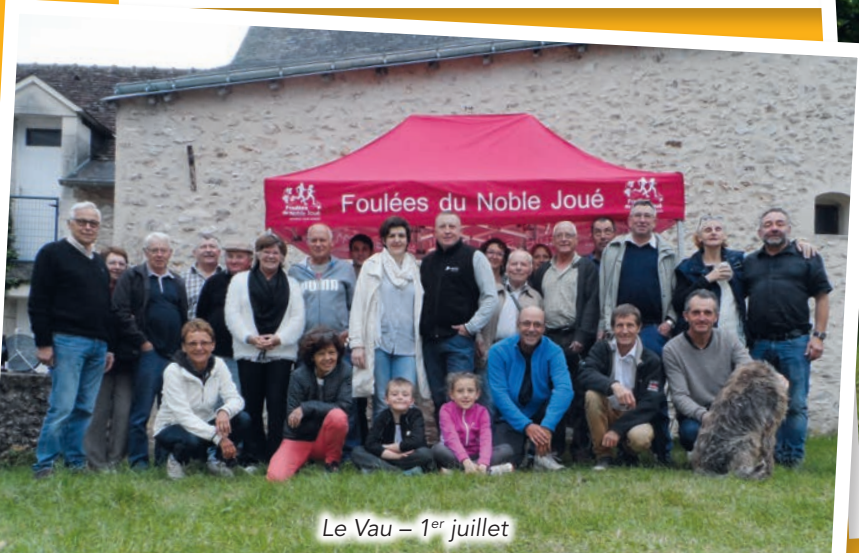
Le Vau – 1 er juillet