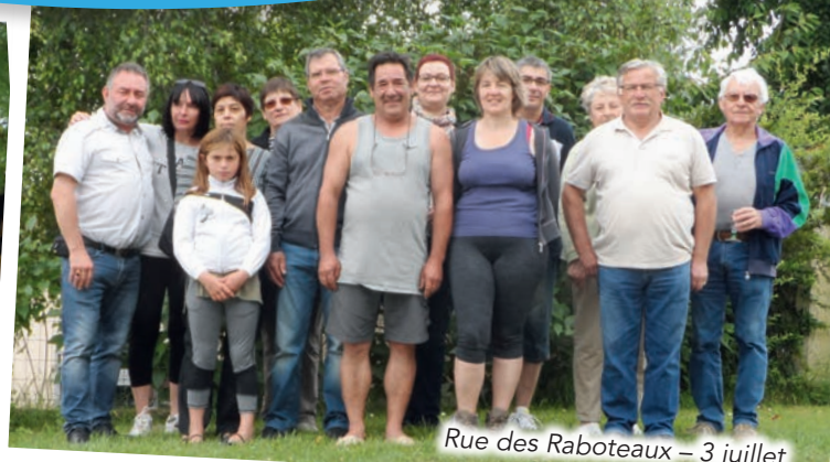
Rue des Raboteaux – 3 juillet