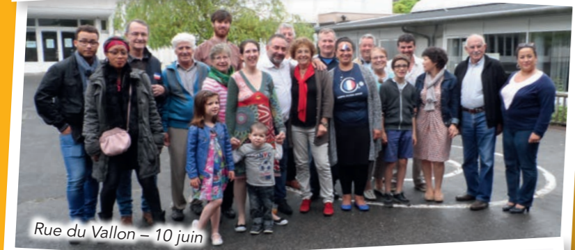
Rue du Vallon - 10 juin