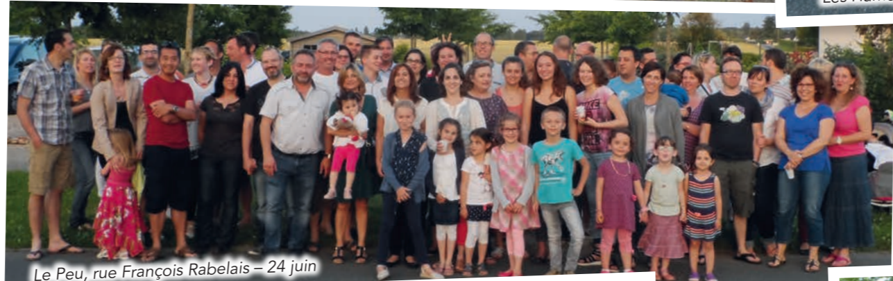
Le Peu, rue François Rabelais - 24 juin