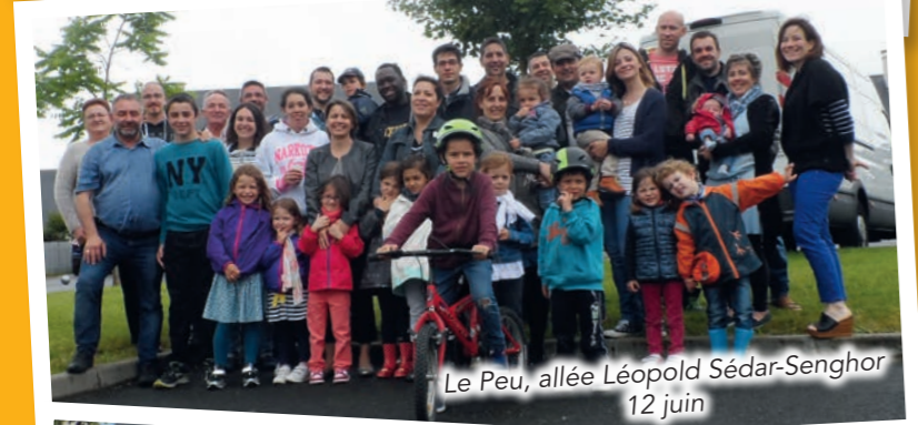
Le Peu, allée Léopold Sédar-Senghor 12 juin