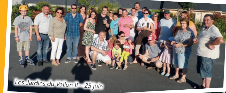
Les Jardins du Vallon II - 25 juin