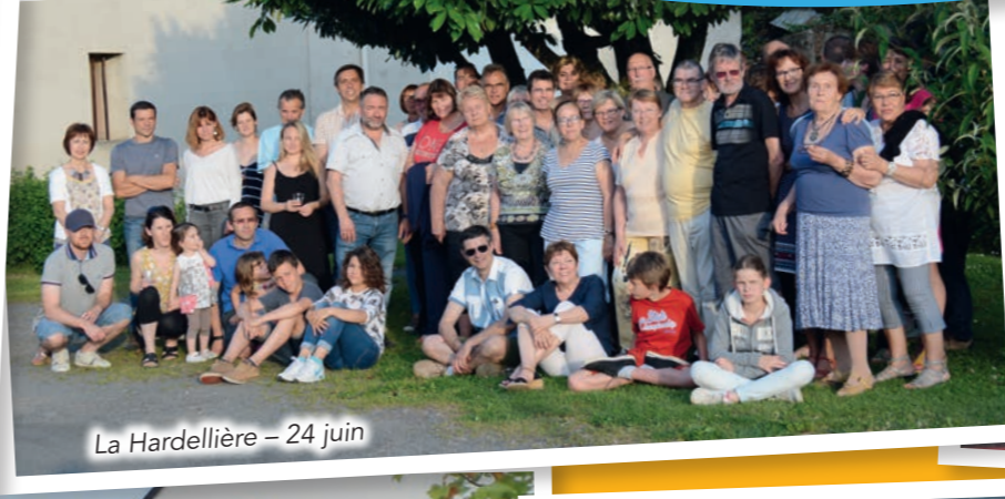
La Hardellière - 24 juin