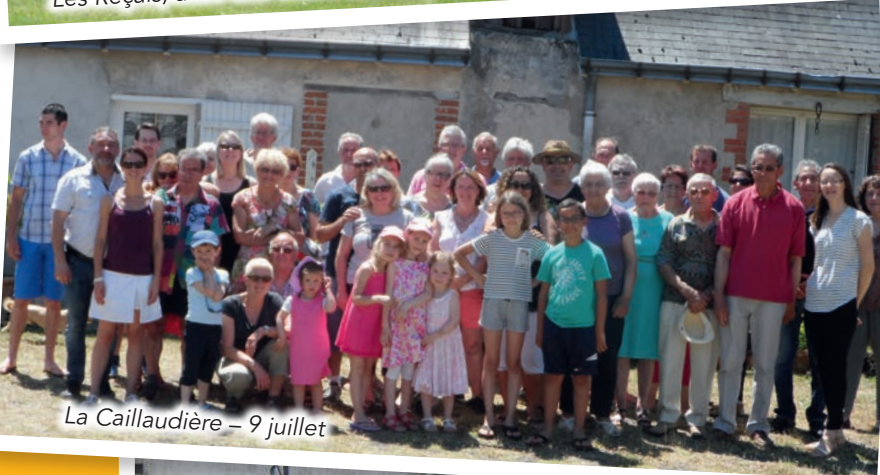
La Caillaudière – 9 juillet