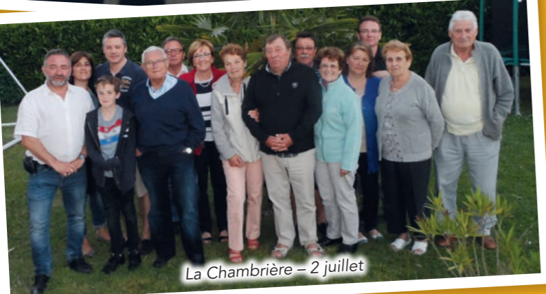
La Chambrière - 2 juillet