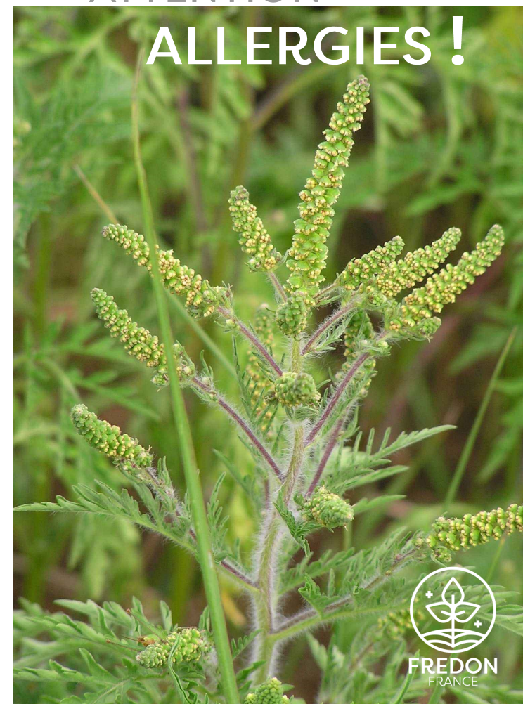
AMBROISIE À FEUILLES D'ARMOISE